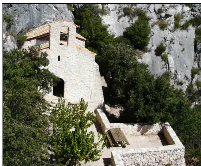
Fig. 3 : Dans son cadre idyllique, la chapelle telle qu'elle apparaît après la restauration de 2000.

Les archives de Saint-Victor permettent de situer sa consécration en 1001, par Amalric évêque d'Aix-en-Provence. Depuis le XIV e siècle, un pèlerinage se fait chaque année, le lundi de Pentecôte, en l'honneur du saint. Ce pèlerinage drainait à l'époque un flux important de pèlerins et les vestiges de calade que l'on peut encore voir sur le sentier d'accès le confirment. Toujours aujourd'hui, après la messe, les fidèles font le tour de la statue du saint et se dirigent jusqu'à l'esplanade située juste sous la chapelle. Là, le prêtre bénit l'assistance et les cultures de la plaine qui