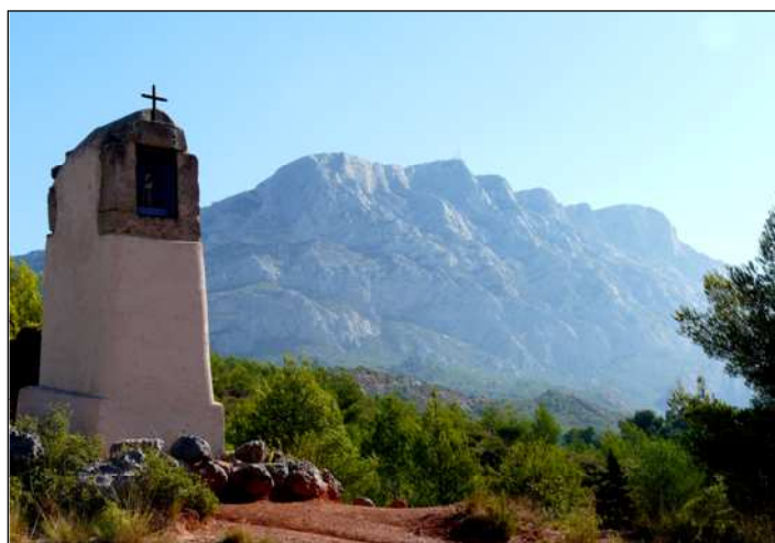
Fig. 2 : L'un des nombreux oratoires qui font penser au caractère sacré de la montagne.

L'aspect grandiose de Sainte-Victoire inciterait à en faire une montagne sacrée. La première implantation religieuse avérée qui s'y est faite, se trouve sur le côté oriental de la chaîne. Sur sa face sud, au pied du Pic des Mouches (1011m), dans un site splendide, s'est niché l'ermitage de Saint-Ser.