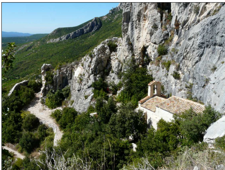
Fig. 4 : La chapelle a cherché un abri illusoire, se blottissant au pied des falaises qui l'ont détruite!

Les derniers éboulements avaient écrasé la toiture et la voûte de la partie extérieure de la chapelle. La restauration entreprise n'a pas refait cette voûte, mais, seulement la toiture supportée par une charpente (fig. 5 et 7). Seules des amorces de voûte subsistent (fig. 5 et 7), elles sont très anciennes, datent-elles de la première chapelle ?