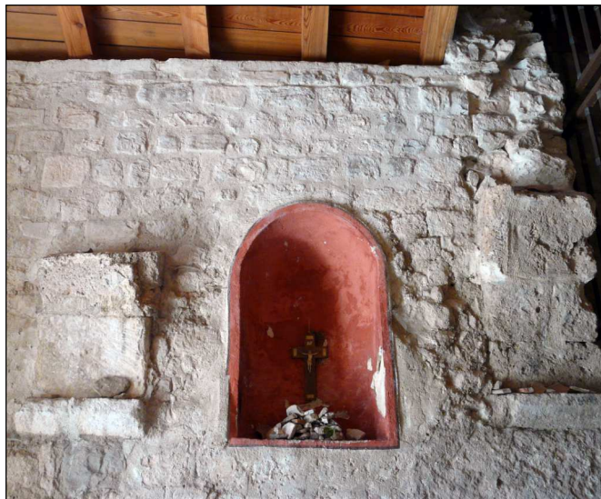
Fig. 5 : Dans le vestibule, les vestiges des arcs supportant l'ancienne voûte. A droite, une grille en fer défend l'accès à la nef.

La porte d'entrée s'ouvre sur un vestibule qui, hors les jours de pèlerinage, reste la seule partie accessible aux visiteurs. Dans les murs du vestibule s'ouvrent deux niches qui devaient abriter des statues. Une grande grille en fer ferme l'accès à la nef et au chœur. Différemment du vestibule et de la nef qui sont bâtis, le chœur et l'autel sont souterrains, occupant la grotte qui aurait servi de premier refuge à saint Ser (fig. 5). L'autel, rustique, est formé par une grande dalle reposant sur une grosse structure maçonnée. Pas de fioritu-