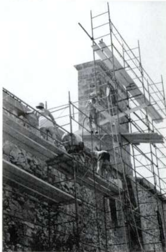
Travaux de réfection du mur Nord.