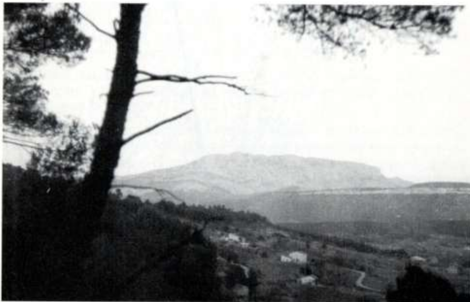
Vue du massif de Sainte-Victoire.