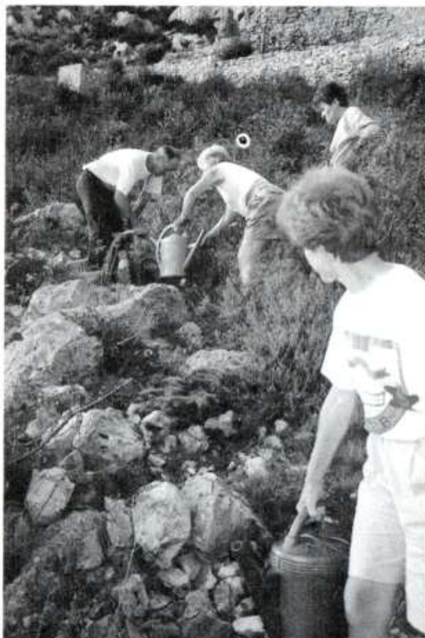
Opération arrosoirs par les membres du GRM.