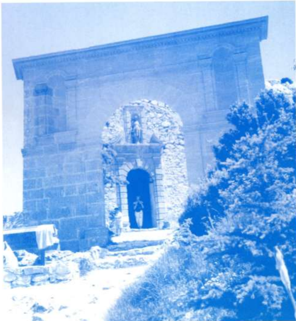
Entrée ouest du Prieuré.

MECANIQUE - PARALLELISME SERVICE APRES-VENTE LIVRAISON DE FUEL VENTE AUTO NEUF ENTRETIEN - RÉVISION