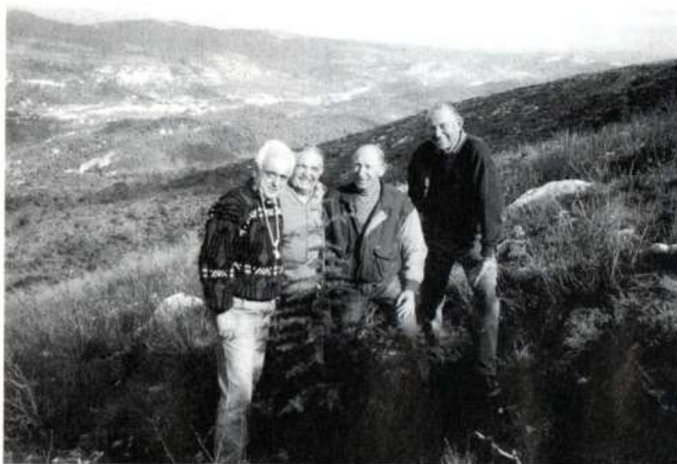
Plantation du cèdre de l'Atlas par l'équipe du CCA et des ASU.