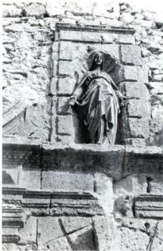
Statue de l'entrée de la chapelle.