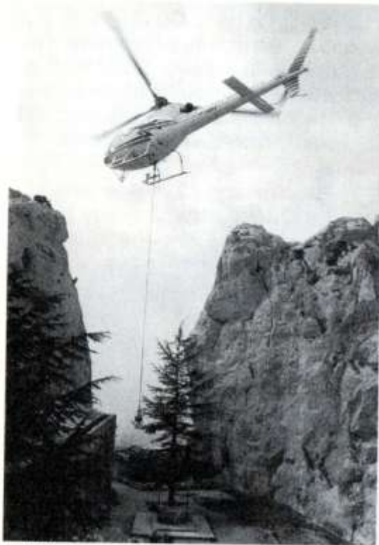
Hélicoptage du matériel et des matériaux.

Ce chantier avait nécessité au préalable d'importants hélicoptages réalisés de main de maître par M. GUEYDON.