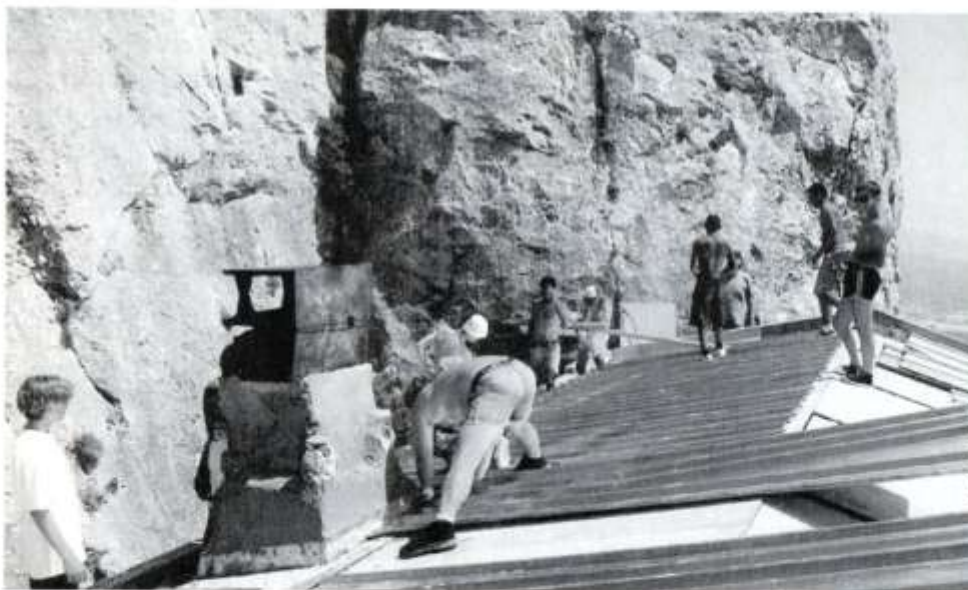
Montage des nouvelles tôles.

Après la réfection de l'ancrage des poutrelles supportant la toiture, cette équipe installa un faux toit en panneaux de contreplaqué épais et recouvrit le tout par des tôles en acier inoxydable. Admirez le remarquable travail de cette équipe qui, composée de jeunes ouvriers, travailla bénévolement pendant deux jours.