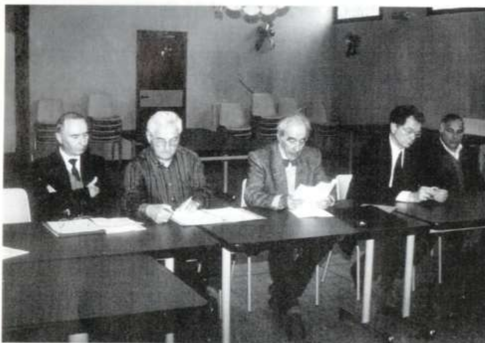
Assemblée générale à Gardanne le 28 mars 1992, le bureau, le maire et son adjoint.