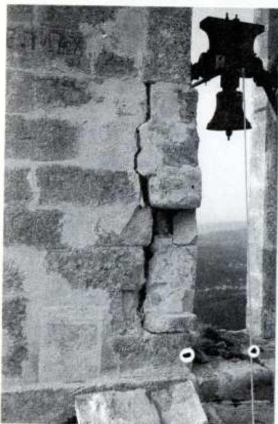
Le clocher endommagé.

Ce chantier avait nécessité au préalable d'importants hélicoptages réalisés de main de maître par M. GUEYDON.