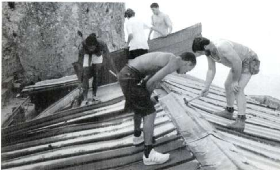
Démontage des tôles rouillées.

Les 19 et 20 juin 1993, le Prieuré connut une activité extraordinaire par la venue d'une équipe de 19 personnes de la Société TRIANGLE de GARDANNE qui, œuvrant sans relâche pendant un jour et demi, sous un soleil de plomb, et offrant l'aspect d'une véritable fourmilière, démontra entièrement les tôles rouillées de la toiture du monastère et du cloître.