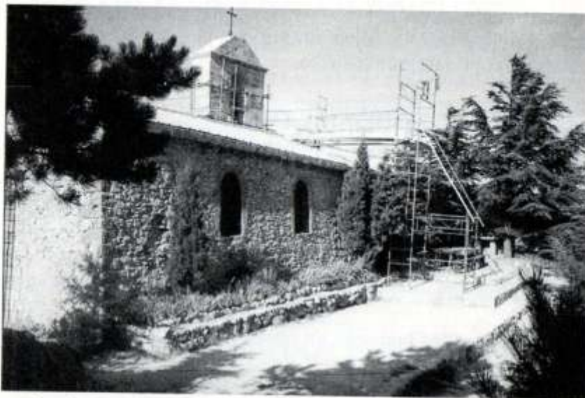
Les échafaudages pour la réfection du clocher Ph. J. Cathala.

De nouvelles pierres taillées vinrent ainsi remplacer celles qui avaient été déscellées ou qui avaient explosé lors de l'impact de la foudre, sur le clocher et sur la façade ouest de la chapelle. Superbe travail qui fut exécuté dans des conditions difficiles en raison de la chaleur et des conditions de vie assez spartiates que l'équipe accepta de mener