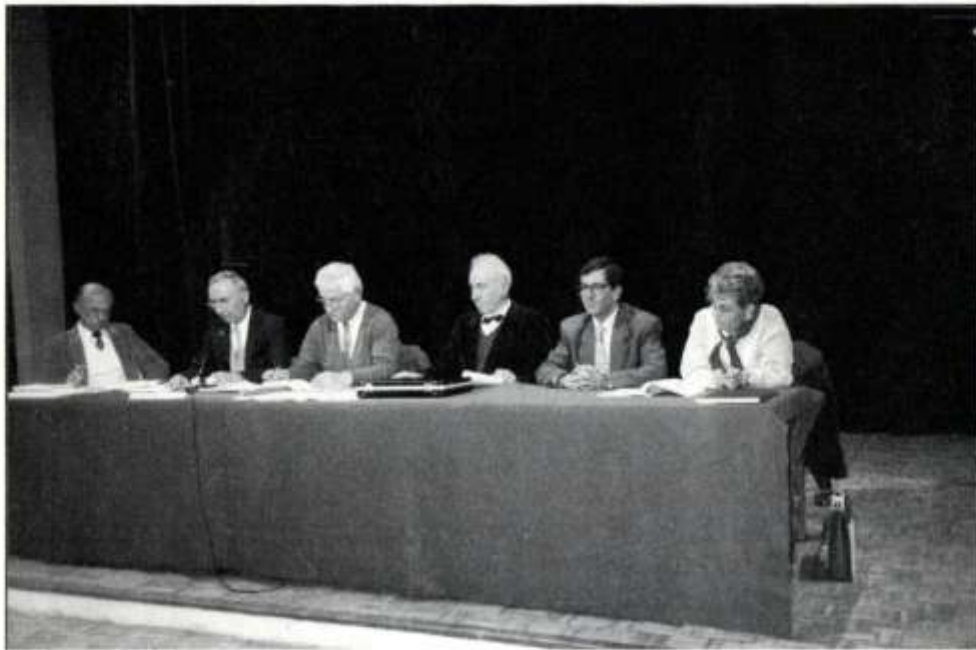
Assemblée Générale du 27 mars 93 à Châteauneuf-le-Rouge, le bureau avec M. le Maire.