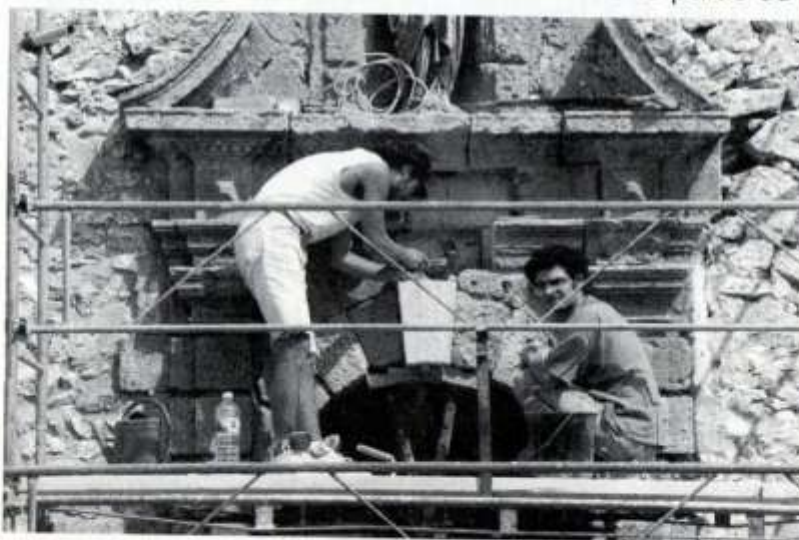
Restauration de la face ouest de la chapelle.

Profitant de la mise en place des échafaudages autour de la chapelle, nous avons pu procéder au renforcement d'une partie du mur de