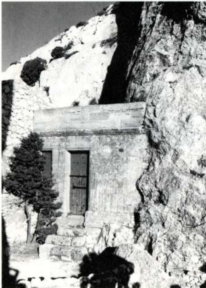
Cellule d'Elzéard der- nier ermite occupant le prieuré.