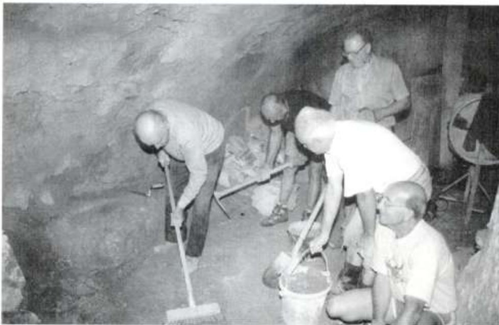
Finition de la cave du monastère.

Après avoir été aménagée, cette cave sert maintenant à entreposer matériels et matériaux.